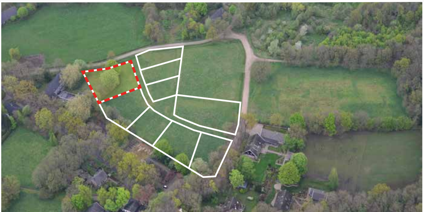
Kavel 20 vanuit de lucht